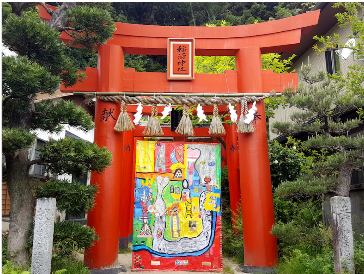
6th version. 2023. Studio Kura, Japan

Œuvre en perpétuelle transformation, elle réagit aux influences passées et à son nouvel emplacement. Elle évolue au contact de son environnement et porte en elle, par un écho persistant, une nouvelle incarnation.