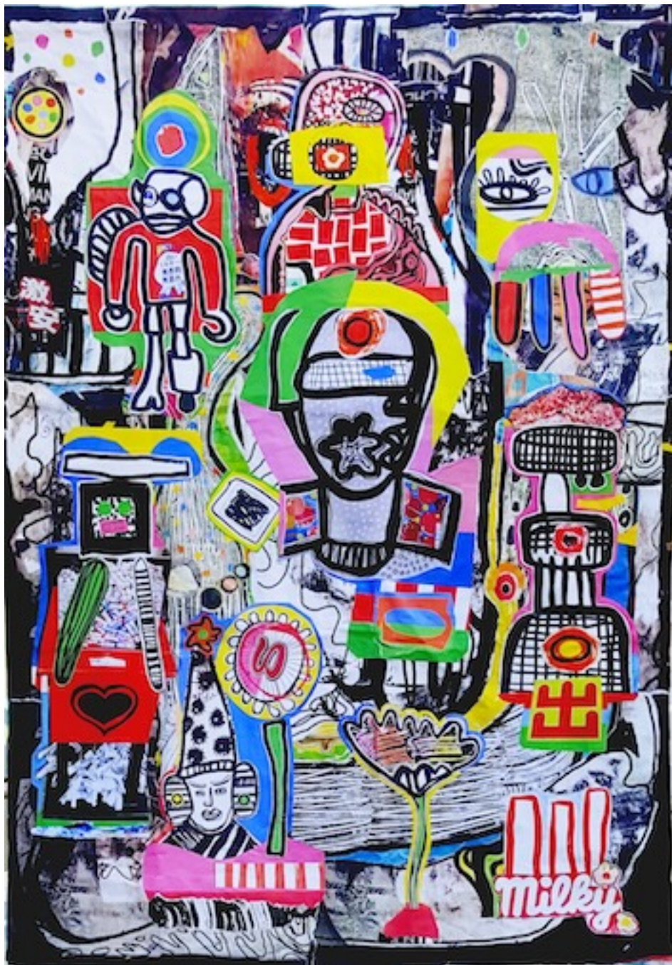
7th version. 2024. Nevis, Caribbean

Littéralement composée de strates, elle porte en elle le noyau de son histoire, invisible mais présent dans son épaisseur, vers une fin indéfinie.